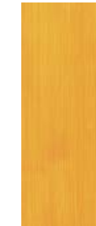
21 Maisgelb Maize Yellow