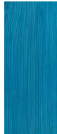
18 Enzian* Gentian