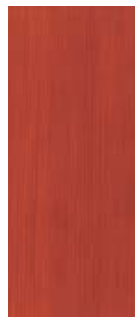
22 Paprika Red Pepper