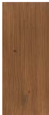
11 Nussbaum Walnut