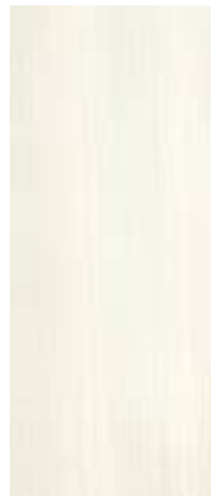
02 Kalkweiß Lime White