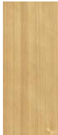
01 Farblos* Colourless