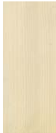
03 Lasurweiß* Glaze White