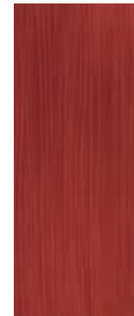
16 Mahagoni Mahogany