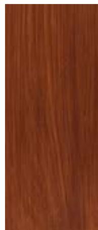
09 Teak Teak